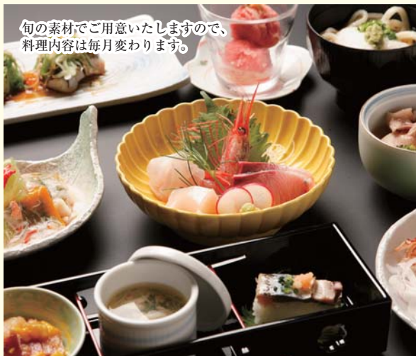
旬の素材をご用意いたしますので、 料理内容は毎月変わります。

●税金など全て込み ●飲み放題込みのコースです。 ●プラス五〇〇円で、プレミアム飲み放題にグレードUP。