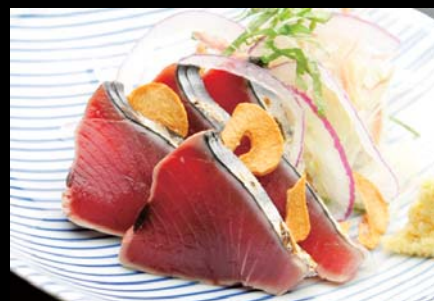
【静岡・三重】 たっぷり香味薬味の 鯉のたたき 750円