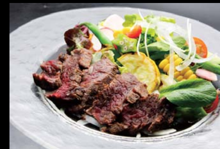
【新得】 トムラウシ・ジャージ牛と 近郊野菜のパワーサラダ 780円