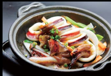
【道内】 いかと夏野菜のゴロみそ焼き 680円