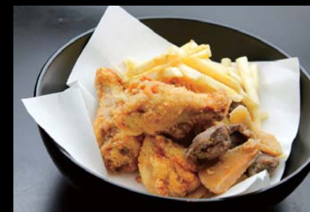
【中札内】 骨付きフライドチキンと 鶏もつの唐揚げ盛合せ 680円