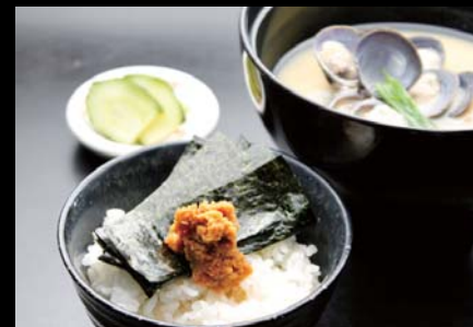
【天塩】 最高級 大しじみ汁と 山わさび御飯 580円