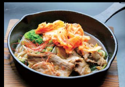
【大樹】 十勝マスターホエー豚と キムチのスタミナ炒め 680円