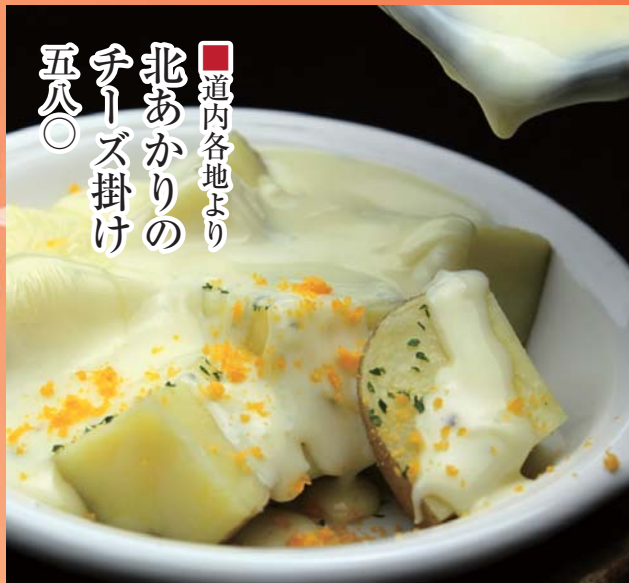
■道内各地より 北あかりの チーズ掛け 五八〇