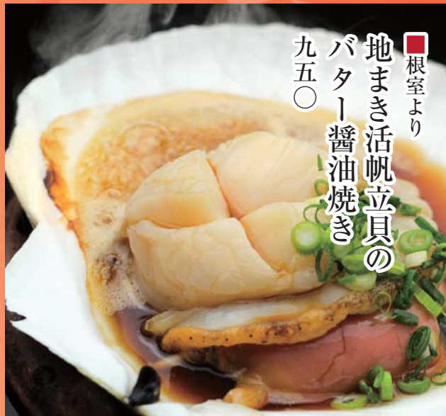
■根室より 地まき活帆立貝の バター醤油焼き 九五〇