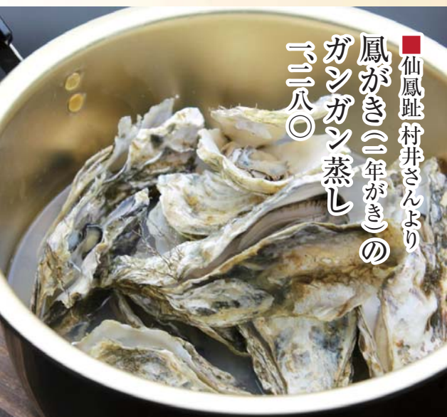
■仙鳳趾村井さんより 鳳がき(一年がき)の ガンガン蒸し 二二八〇