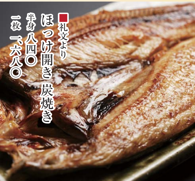
■礼文より ほつけ開き炭焼き 半身八四〇 一枚一六八〇