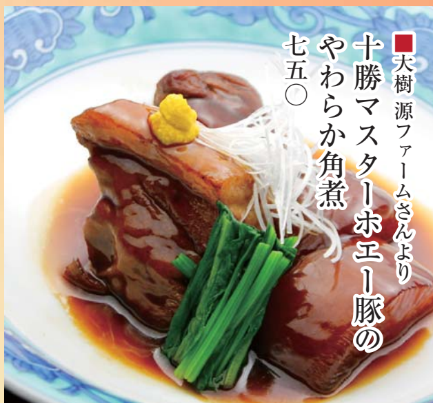
■大樹源ファームさんより 十勝マスターホエー豚の やわらか角煮 七五〇