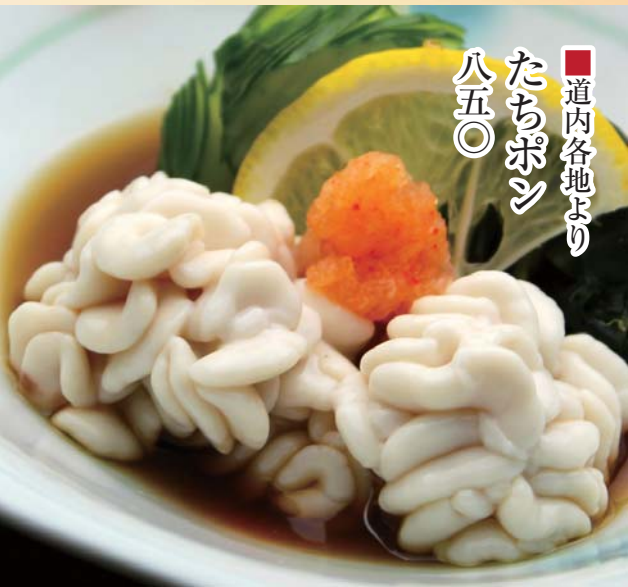
■道内各地より たちぼん 八五〇