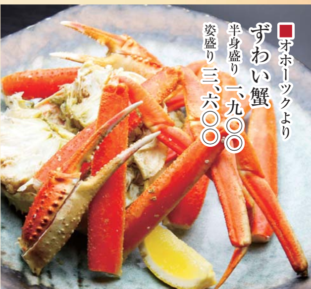
■オホーツクより ずわい蟹 半身盛り一、九〇〇 姿盛り三、六〇〇