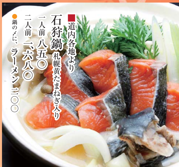
■道内各地より 石狩鍋 札幌黄たまねぎ入り 一人前八五〇 二人前一、六八〇 ●鍋のみに、ラーメン三〇〇