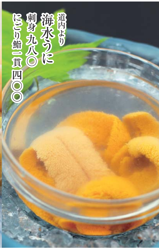
道内より 海水うに 刺身九八〇 にぎり鮭一貫四〇〇