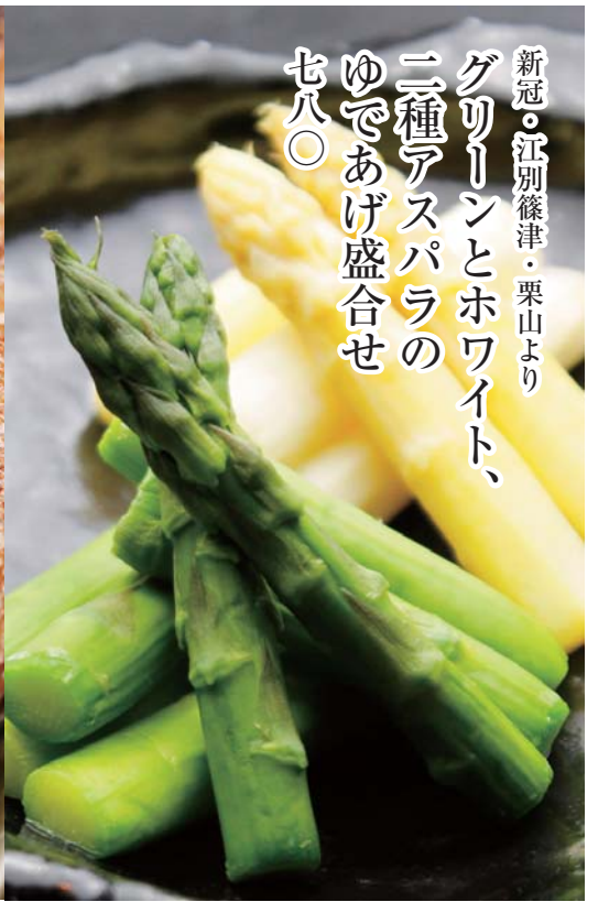
新冠・江別篠津・栗山より グリーンとホワイト、 二種アスパラの ゆであげ盛合せ 七八〇