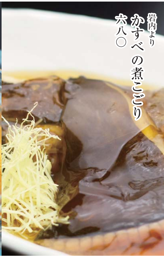
岩内より かすべの煮ごころ 六八〇