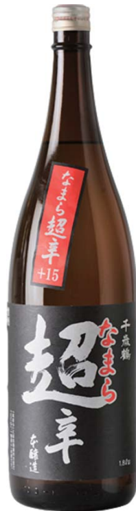
札幌なまら超辛「本醸造 超辛口+15」 銚子 四三〇 とつくり 一、三〇〇