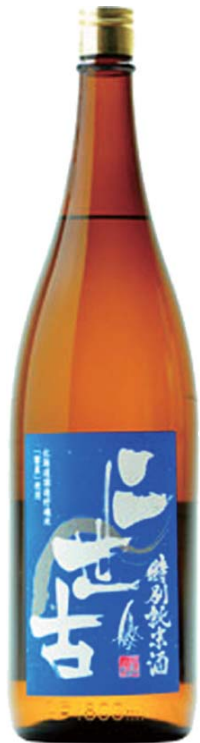
にせこ ニセコニセ古「特別純米 辛口+5」 銚子 五八〇 とつくり 一、六八〇