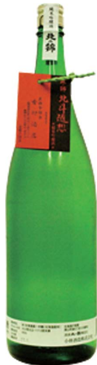
きたのにしき 栗山 北の錦 北斗随想「純米吟醸 やや甘口-1」 銚子 六八〇 とつくり 一、〇〇〇

GW期間中は、 家族で嬉しい、 北〇ファミリーデー 連日開催!! お子様ドリンク 無料サービス!!