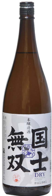
こくしむそつ 旭川 国士無双 DRY「本醸造 超辛口+16」 銚子 五三〇 とつくり 一、五三〇