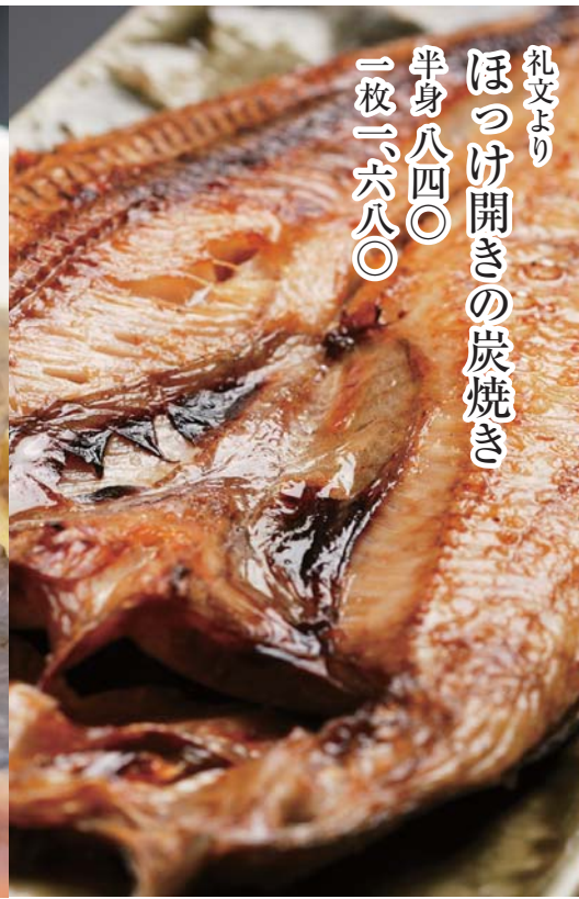
礼文より ほっけ開きの炭焼き 半身八四〇 一枚一六八〇