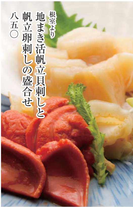
根室より 地まき活帆立貝刺しと 帆立卵刺しの盛合せ 八五〇