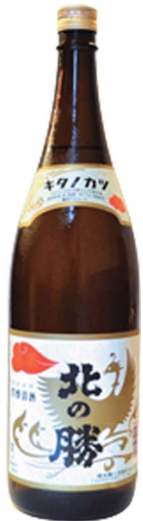
きたのかつ 根室 北の勝 鳳凰「本醸造 辛口+1」 銚子 四三〇 とつくり 一、三〇〇