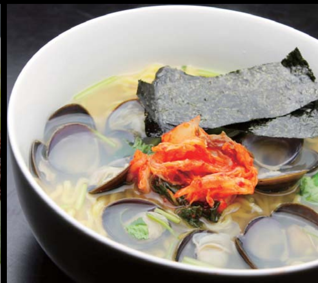
たっぷりしじみのキムチ・ラーメン 通常価格 900円 ▶ 20%OFF!! 720円