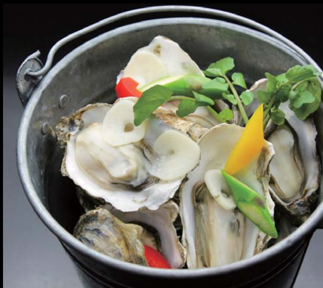
一年がきのガンガン・ガーリック蒸し 通常価格 1650円 ▶ 20%OFF!! 1320円