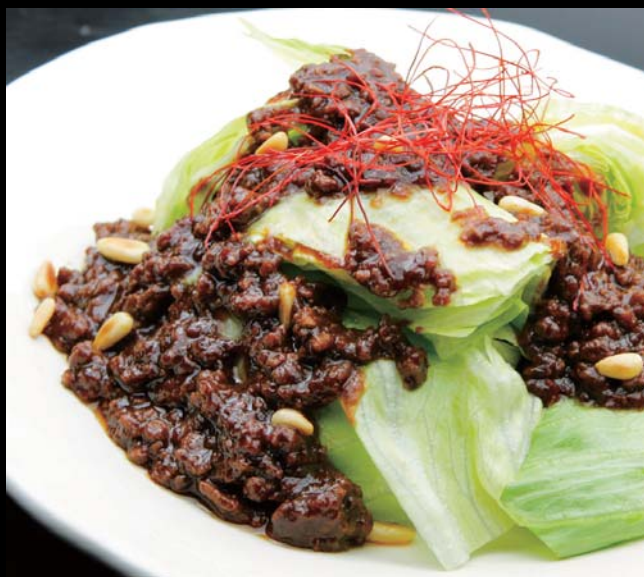
とれたてレタスのピリ辛肉みそ掛け 通常価格 580円 ▶ 20%OFF!! 464円