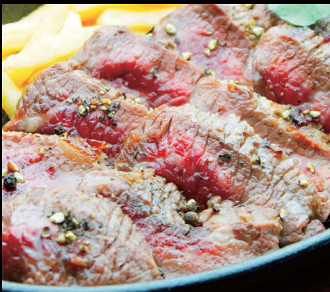
新得トムラウシ・ジャージー牛の鉄板ステーキ 通常価格 1280円 ▶ 20%OFF!! 1024円