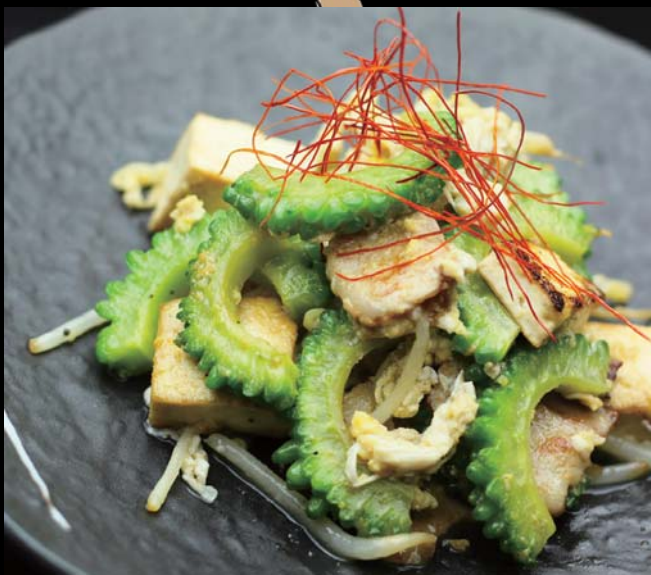
ゴーヤ・チャンプルー 通常価格 780円 ▶ 20%OFF!! 624円