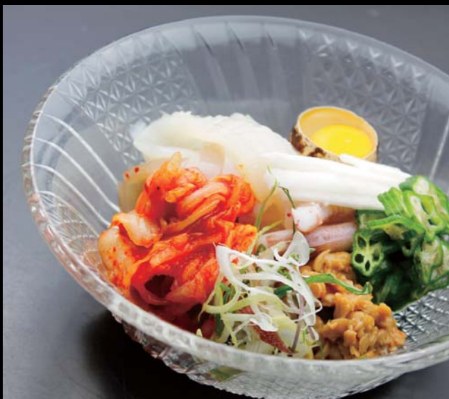
生いかのスタミナねばとろ 通常価格 680円 ▶ 20%OFF!! 544円