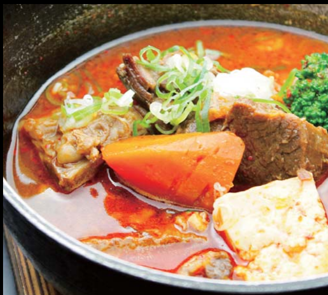
やわらか道産牛のピリ辛煮込み 通常価格 780円 ▶ 20%OFF!! 624円