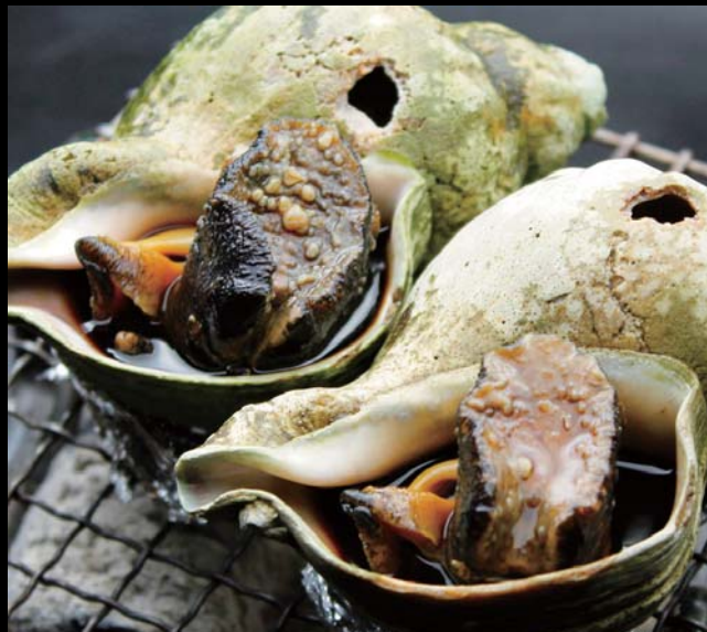
海の家、青つぶ焼き 通常価格 850円 ▶ 20%OFF!! 680円