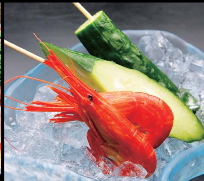
夏の味! 北海縮えびと冷やしきゅうり 通常価格 580円 ▶ 20%OFF!! 464円