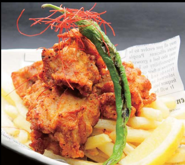
“スパイシー”ザンギと北海道ポテトフライ 通常価格 780円 ▶ 20%OFF!! 624円