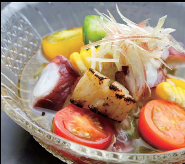
炙り帆立とたこの“爽やか”美味酢掛け 通常価格 750円 ▶ 20%OFF!! 600円