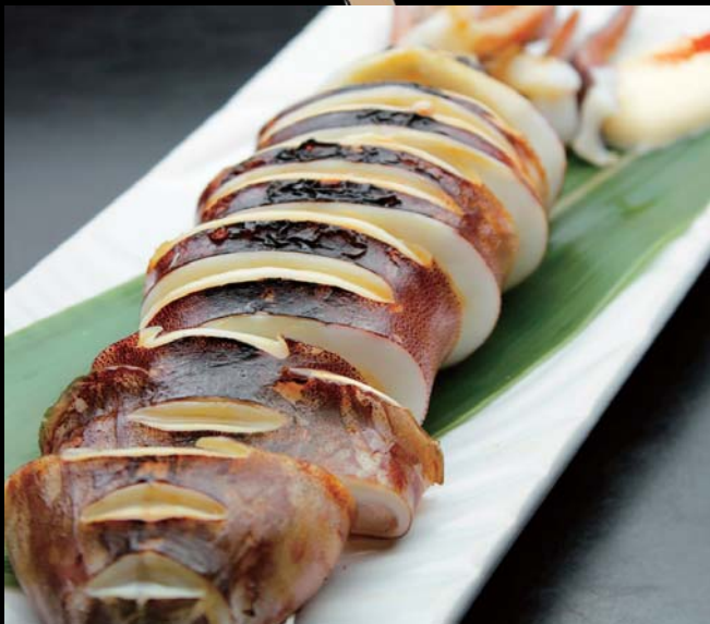
いかの屋台焼き 通常価格 750円 ▶ 20%OFF!! 600円