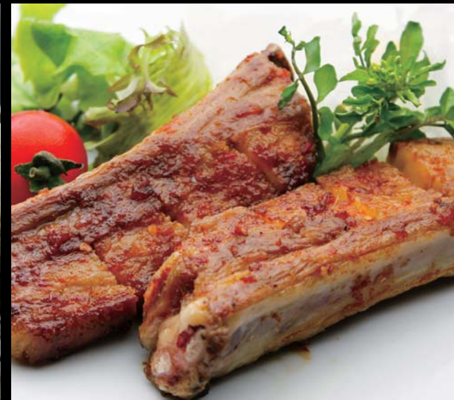
豪快! ラム・スペアリブの炭焼き 山わさび添え 通常価格 980円 ▶ 20%OFF!! 784円