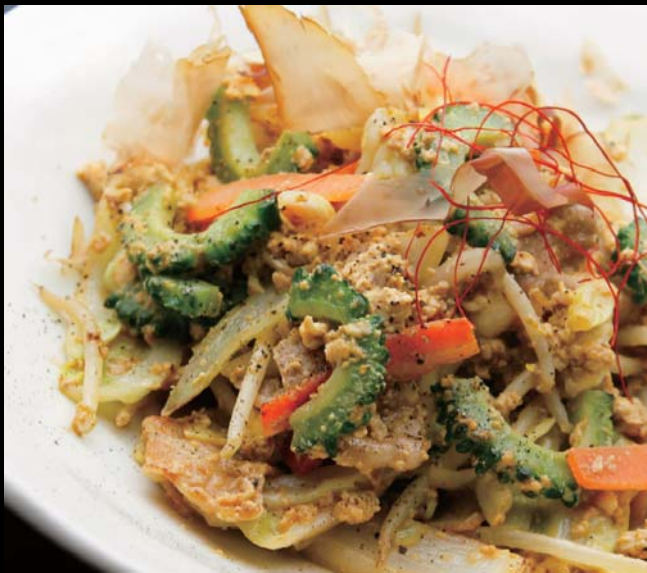
夏のスタミナ! ゴーヤ・チャンプルー 通常価格 780円 ▶ 20%OFF!! 624円