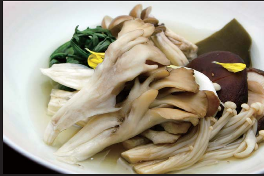
道内より 4種きのこ(舞茸・原木しいたけ・しめじ・えのき)のちり蒸し 通常価格 680円 ▶ 20%OFF!! 544円