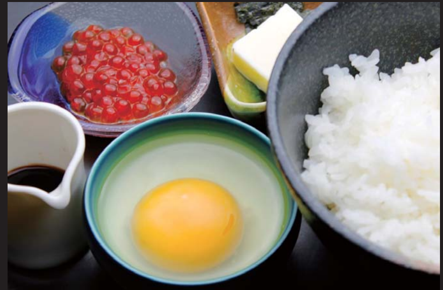
自家製いくら醤油漬けとカルピスバターで食べる、極上たまご掛け御飯 通常価格 750円 ▶ 20%OFF!! 600円