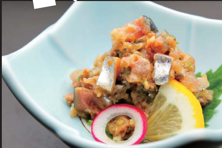
根室より 秋刀魚のなめろう 通常価格 600円 ▶ 20%OFF!! 480円