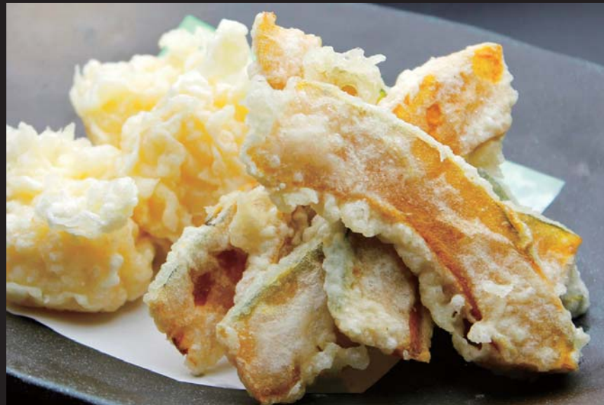
札幌 松森さんより 大浜みやこ南瓜と熟成モッツァレラ为天ぷら 通常価格 680円 ▶ 20%OFF!! 544円