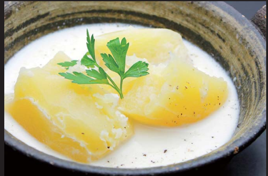
音更より プレミアム・メイクインのミルクバター煮 通常価格 550円 ▶ 20%OFF!! 440円