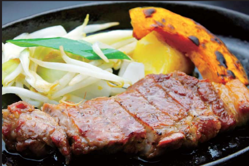
大樹より 十勝マスターホエー豚と秋野菜の鉄板焼き 通常価格 850円 ▶ 20%OFF!! 680円