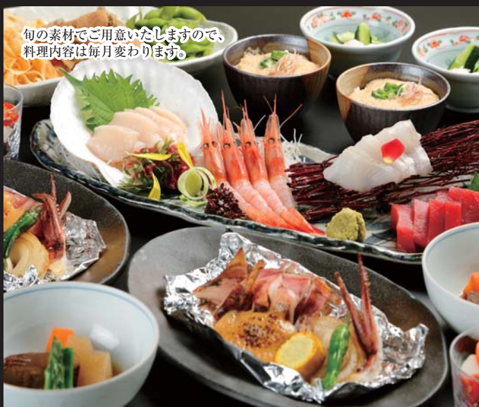
旬の素材をご用意いたしますので、 料理内容は毎月変わります。