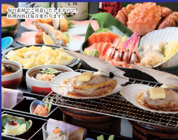
旬の素材をご用意いたしますので、 料理内容は毎月変わります。