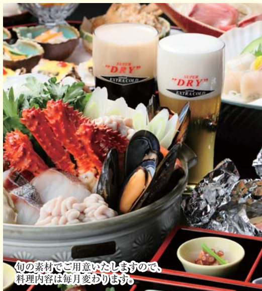
旬の素材をご用意いたしますので、 料理内容は毎月変わります。

●税金など全て込み ●飲み放題込みのコースです。 ●旬の食材を使用するため、料理内容は毎回変わります。