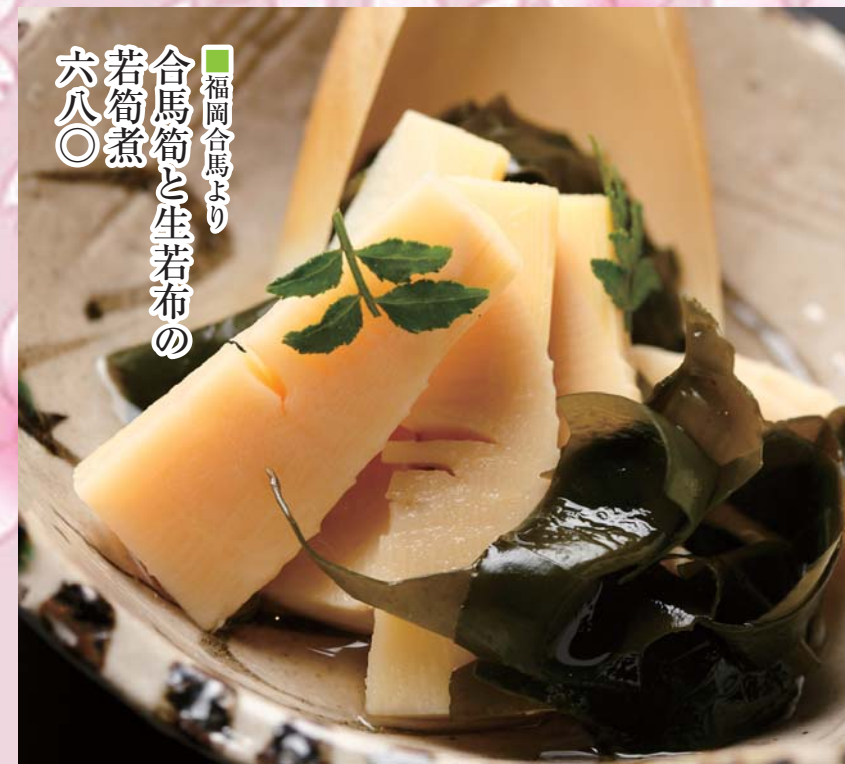
■福岡合馬より 合馬筍と生若布の 若筍煮 六八〇