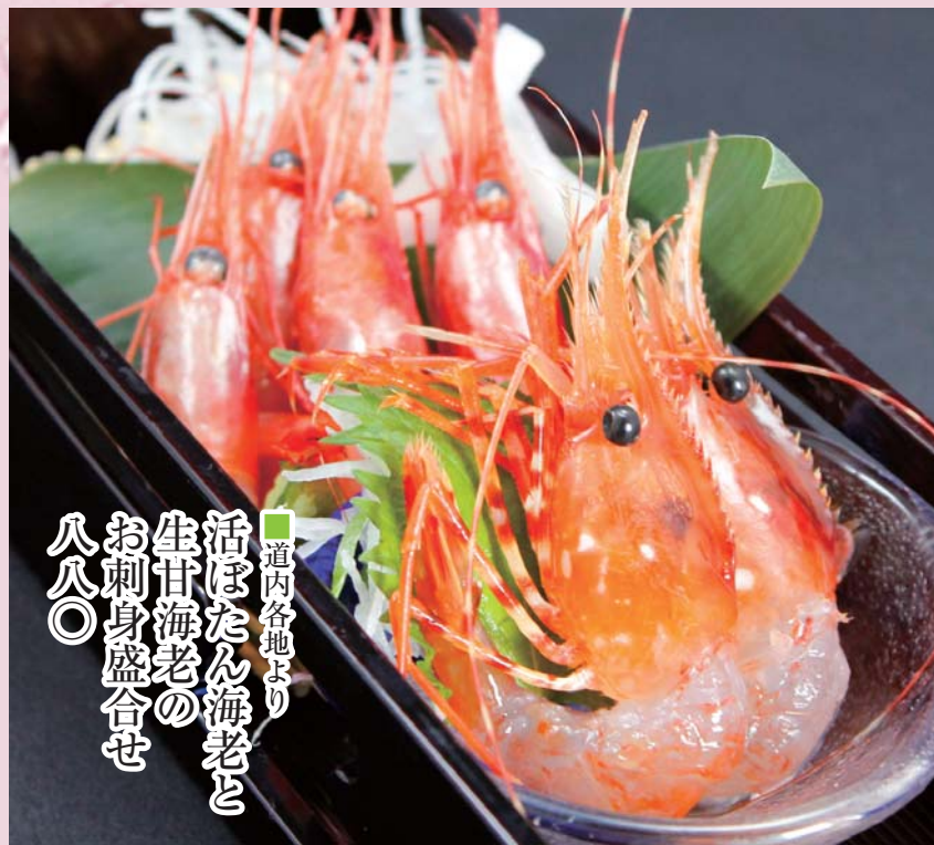
■道内各地より 活きたん海老と 生甘海老の お刺身盛合せ 八八〇