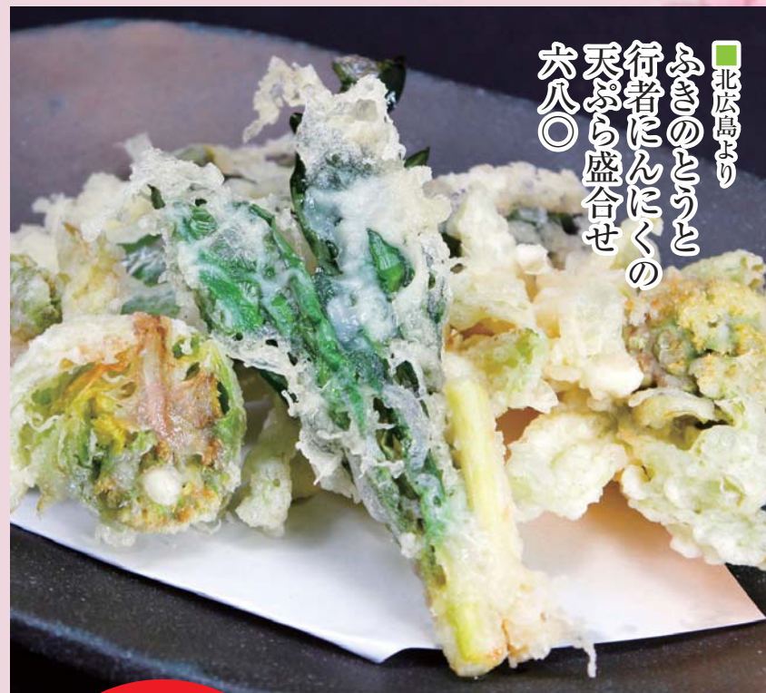
■北広島より ふぎのとうと 行者にんにくの 天ぷら盛合せ 六八〇