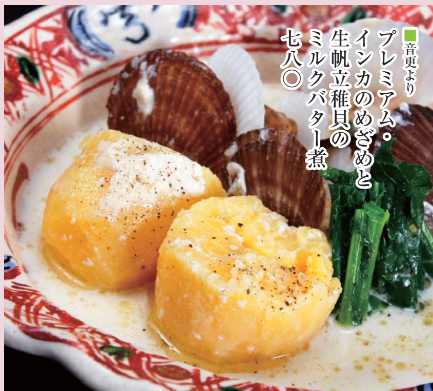
■音更より プレミアム。 インカのめざめと 生帆立稚貝の ミルクバター煮 七八〇