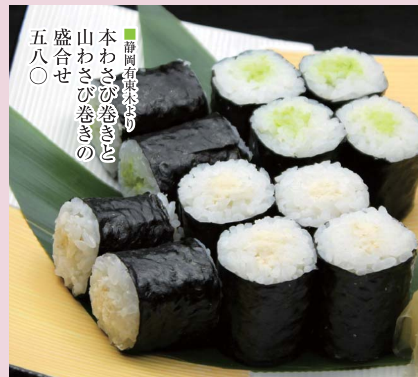
■静岡有東木より 本わさび巻きと 山わさび巻きの 盛合せ 五八〇