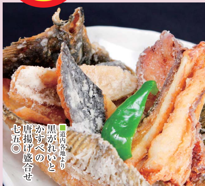
■道内各地より 黒がれいと かすべの 唐揚げ盛合せ 七五〇