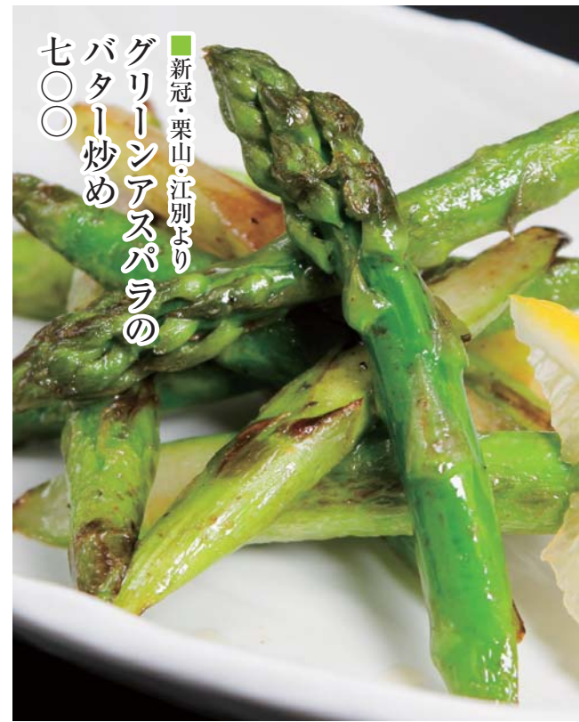
新冠・栗山・江別より グリーンアスパラの バター炒め 七〇〇