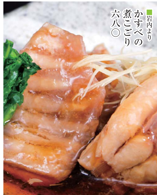
岩内より かすべの 煮ごごり 六八〇