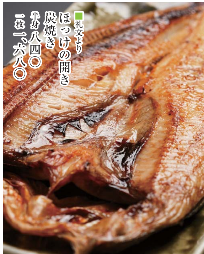
礼文より ほつけの開き 炭焼き 半身八四〇 一枚一六八〇