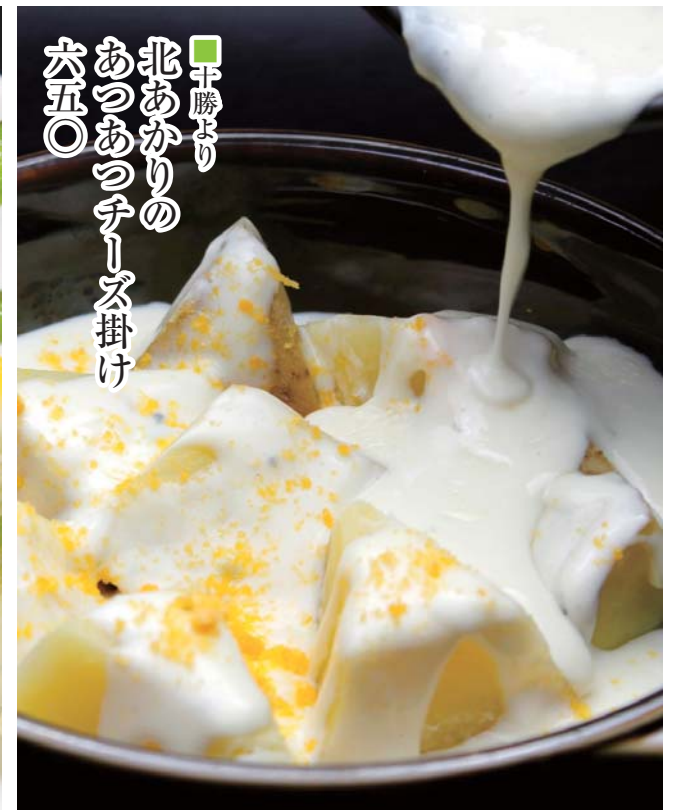
千勝より 北あかりの あつあつチーズ掛け 六五〇