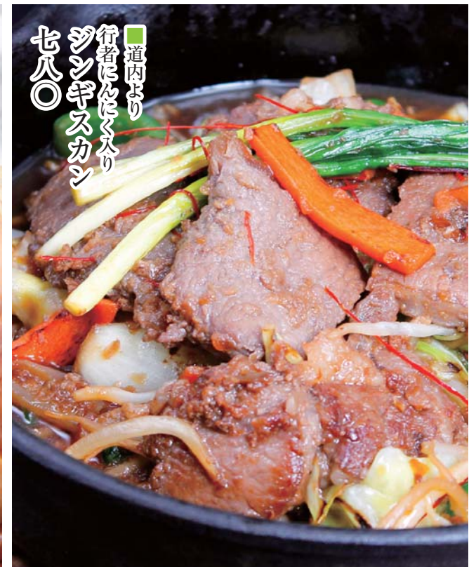
道内より 行者にたく入り ジンギスカン 七八〇