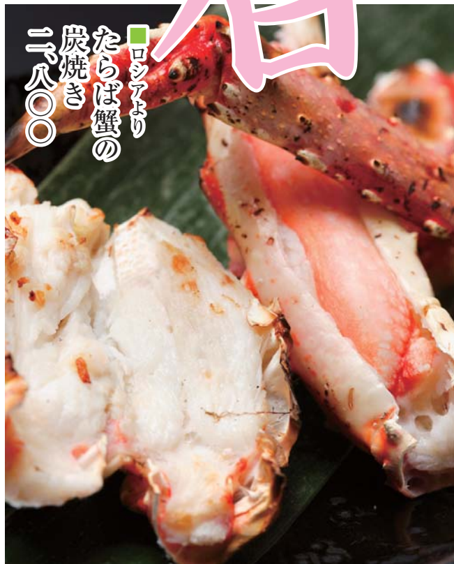
ロシアより たらば蟹の 炭焼き 二二八〇〇