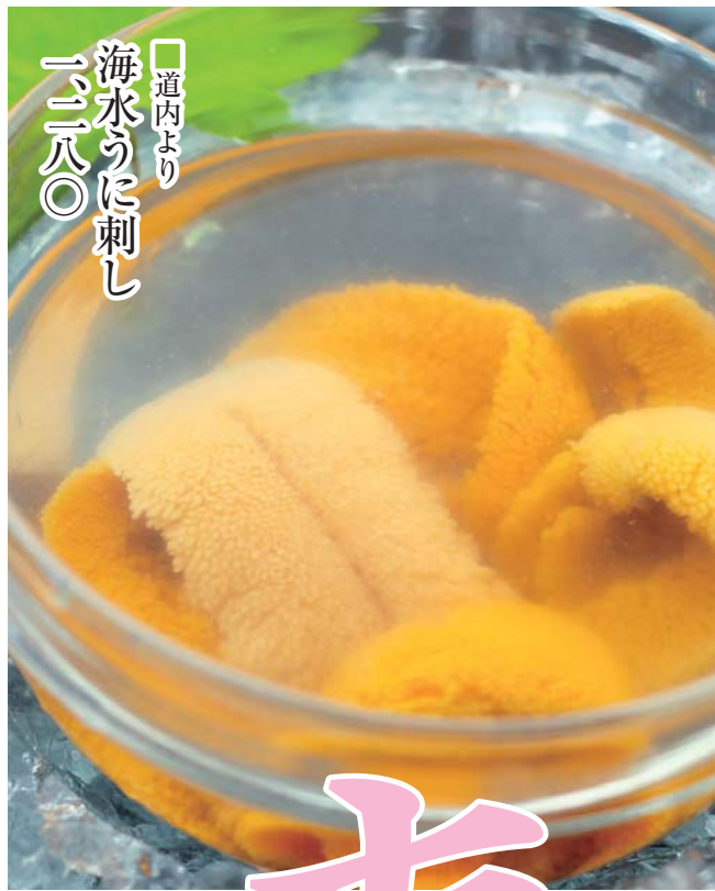
道内より 海水うに刺し 二二八〇