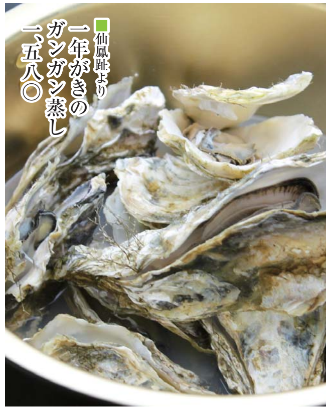
仙鳳趾より 一年がきの ガンガン蒸し 一五八〇