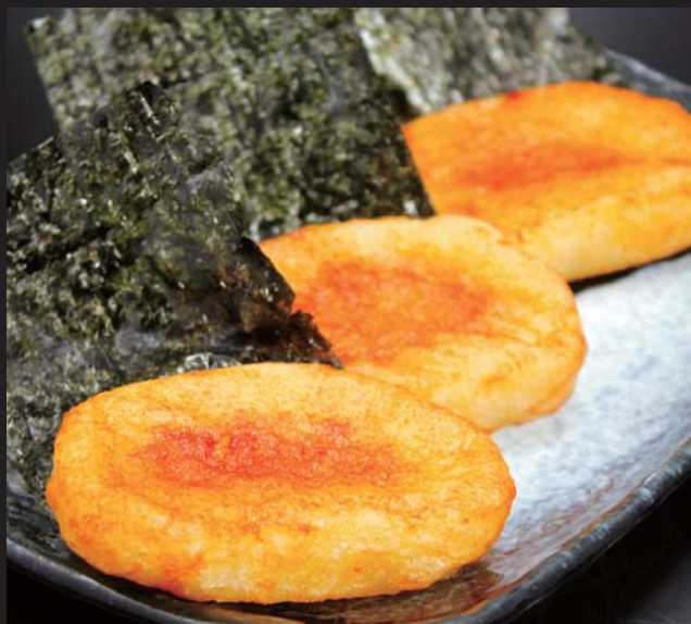
【道内各地より】 手づくり 芋もち (3個) 400円