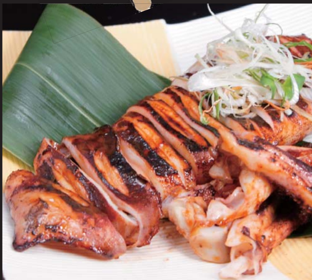
【函館より】 屋台のイカ焼き 750円