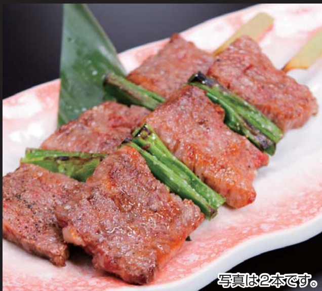
【新得より】 トムラウシ・ジャージー牛の 牛串焼き (一本) 580円 写真は2本です。