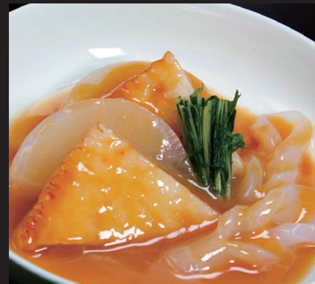
【道内各地より】 北O特製 味噌おでん 480円