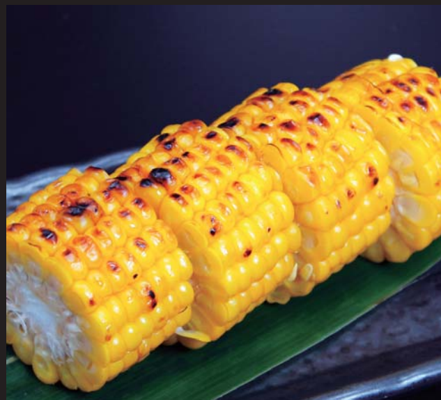
【江別市篠津より】 焼きとうきび 380円