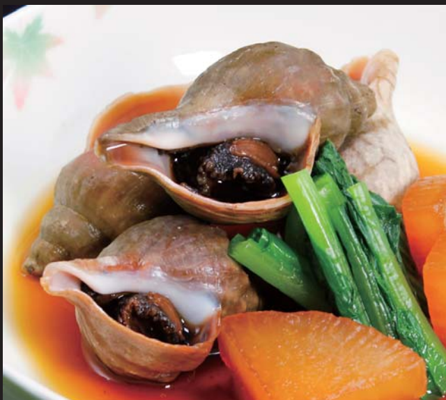
【道内各地より】 青つぶのはつかり醤油煮 680円