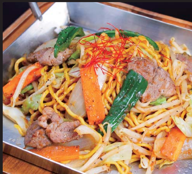
【北O 夏の名物!】 ジンギスカン焼きそば 780円