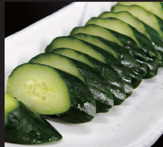
【江別市篠津より】 胡瓜の一本漬け 380円