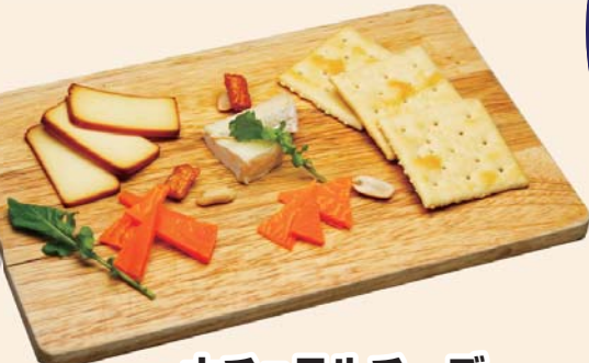
ナチュラルチーズ 3種盛り合わせ 通常価格 780円▶ かきと同時注文で、 700円