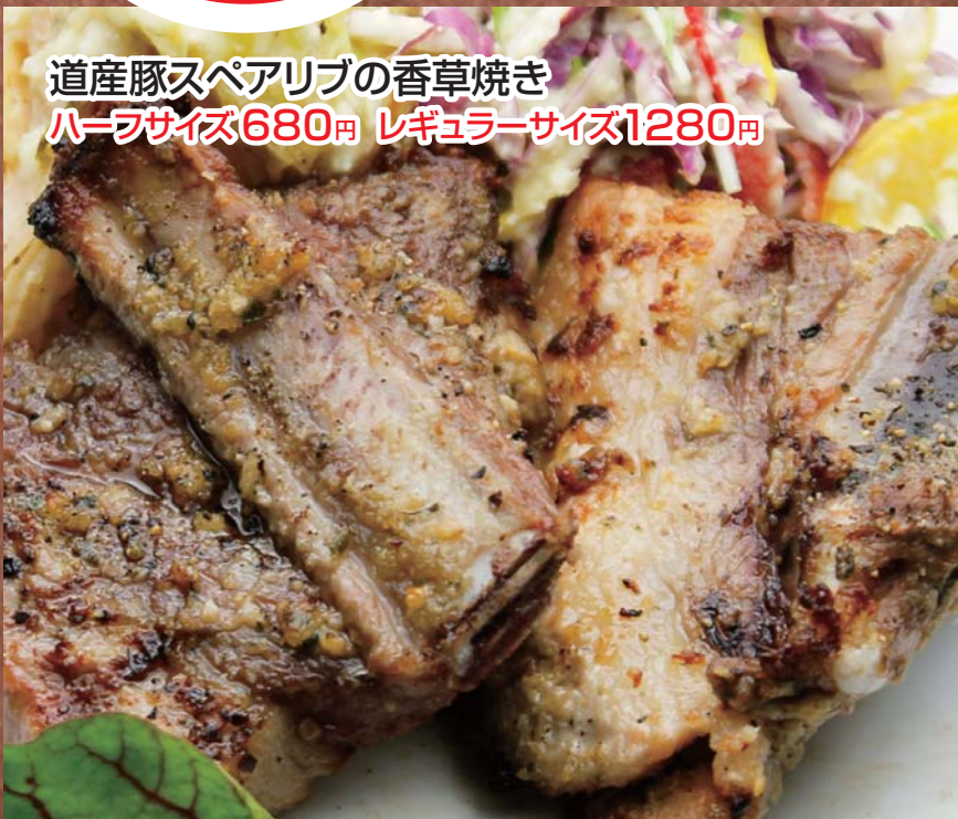
道産豚スペアリブの香草焼き ハーフサイズ680円 レギュラーサイズ1280円