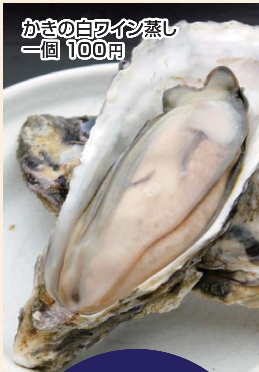
かきの白ワイン蒸し 一個 100円