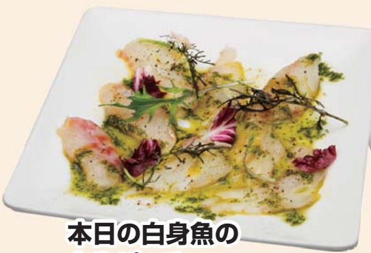
本日の白身魚の カルパッチョ 通常価格 750円▶ かきと同時注文で、 680円