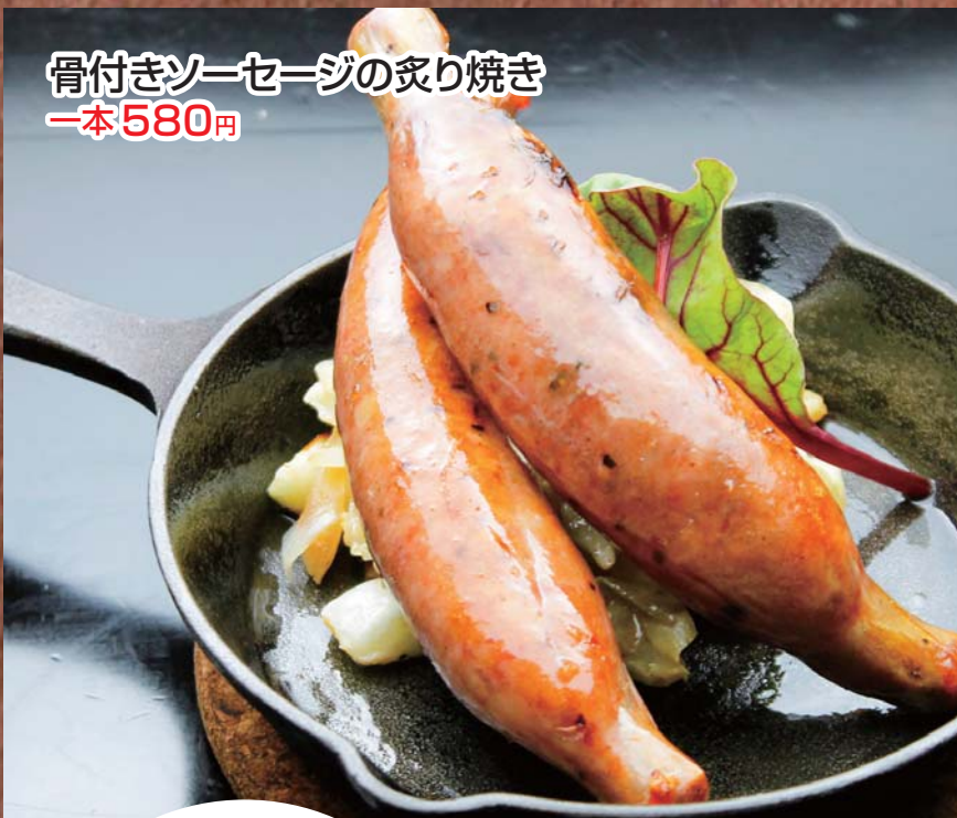
骨付きソーセージの炙り焼き 一本580円