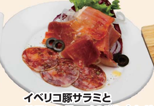
イベリコ豚サラミと ハモンセラノの盛り合わせ 通常価格 680円▶ かきと同時注文で、 600円