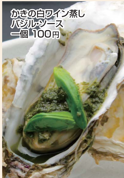
かきの白ワイン蒸し バジルソース 一個 100円