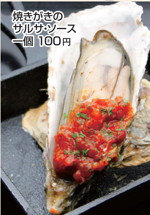
焼きがきの サルサソース 一個 100円