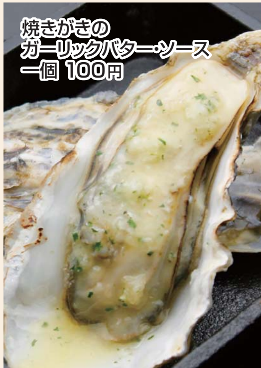
焼きがきの ガーリックバターソース 一個 100円